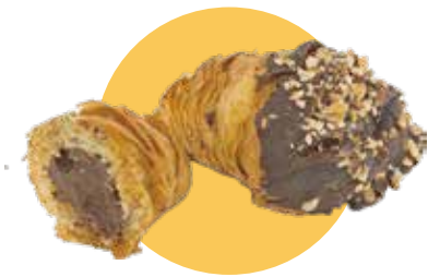
APOLLINA GLASSATA cioccolato