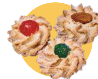
PASTA DI MANDORLA