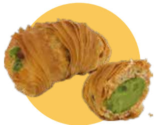
APOLLINE crema pistacchio