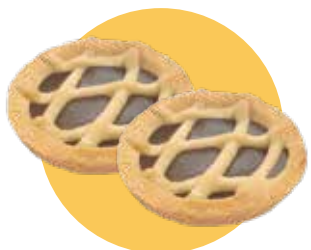
CROSTATINA varianti: cioccolato, albicocca e ciliegia