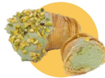
APOLLINA GLASSATA crema pistacchio