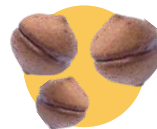
BACI DI DAMA cacao