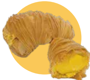
APOLLINA crema limone