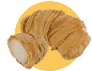
APOLLINA cioccolato bianco