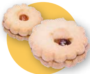
MARGHERITA varianti: cioccolato, albicocca e ciliegia