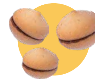
BACI DI DAMA bianco